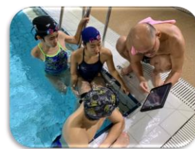
フォーム撮影のサポート