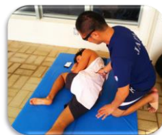
トレーナー業務のサポート