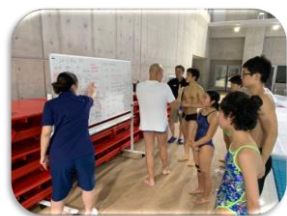
コーチのサポート