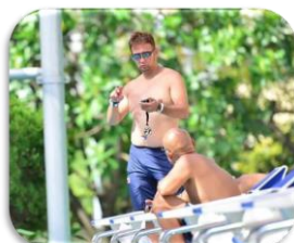
タイム測定のサポート